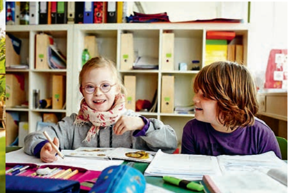
Integrative Montessori Schule, München